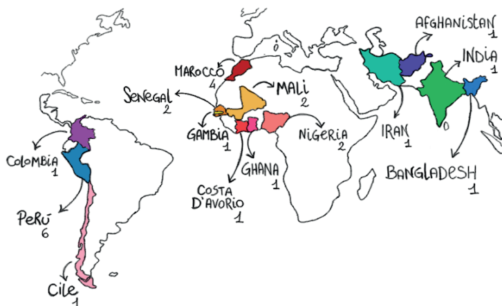
Figura 3.2 Aree geografiche di provenienza

Come si evince dalla Figura 3.2 , gli intervistati sudamericani provengono principalmente dagli stati della costa occidentale: Colombia, Cile e, in particolare, Perù. Da notare anche che le donne intervistate (4 su 5) sono di provenienza sudamericana.